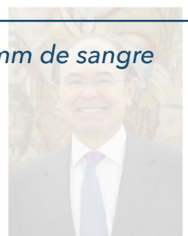
Pío García Escudero / CASA REAL

Durante su tramitación se presentaron enmiendas de varios grupos parlamentarios, que dieron lugar a un constructivo debate en el que se consensuó la moción finalmente aprobada.